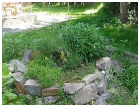
Bylinková špirála začiatkom leta