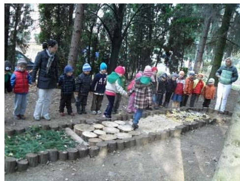
Environmentálny hmatový chodník

Námety pre zábavno-poučné vyučovanie s témou ekologickej stopy Téma: Stravovanie Stupeň: MŠ Aktivita: LIEČIVÁ ZÁHRADKA BABIČKY ANIČKY