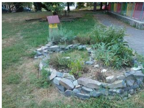
Kľúčová dierka s bylinkami na jar