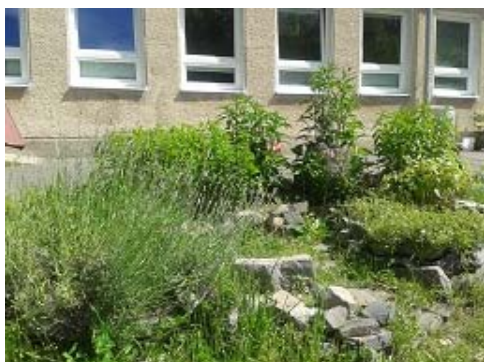
Kľúčová dierka začiatkom leta