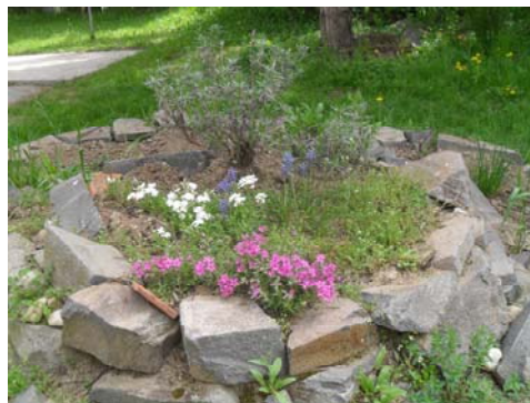
Bylinková špirála na jar